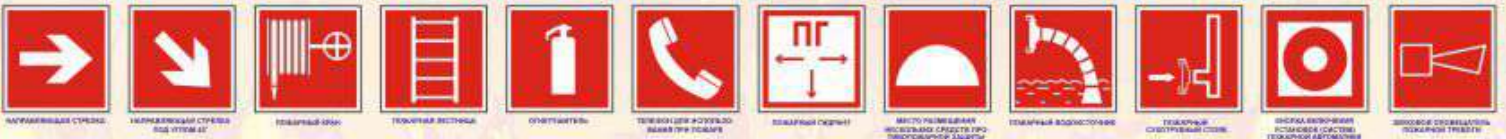
НАПРАВЛЕНИЕ СТРЕЛКА, НАПРАВЛЕНИЕ СТРЕЛКА ВНИЗ И ВПРАВО, ПОЖАРНЫЙ ОЗВУЧЕНИЕ, ПОЖАРНАЯ ЭСКАПАЦИЯ, ОПОВЕЩАТЕЛЬ, ТЕЛЕФОН (СНУ) И СООБЩЕНИЕ ОБ ОЖИДАЮЩЕМ ПОЖАРЕ, ПОЖАРНЫЙ СЕКЦИОН, МЕСТО РАЗМЕЩЕНИЯ НЕВОЗМОЖНО СРЕДСТВО ПРИ НЕВОЗМОЖНОСТИ ЗАЩИТЫ, ПОЖАРНЫЙ ВОДОСТОЯНОК, ПОЖАРНЫЙ СИГНАЛЬНЫЙ СТОЛБ, ИНОГДА ВСТРЕЧАЮТСЯ ИСПОЛНЕНИЯ СИМВОЛЫ ПОЖАРНОЙ АВТОМОБИЛЯ, ЗНАКОВ О СООБЩЕНИИ ПОЖАРНОЙ ТРЕБОВАТЬ