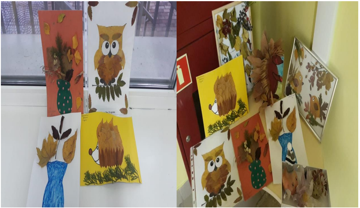
Удивительное время года «Осень»