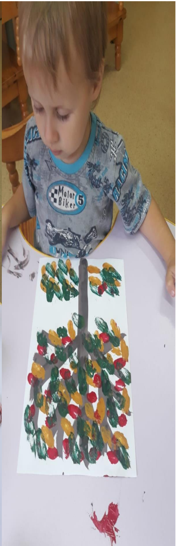
Лепка рельефная из пластилина «Падают, падают ЛИСТЬЯ »