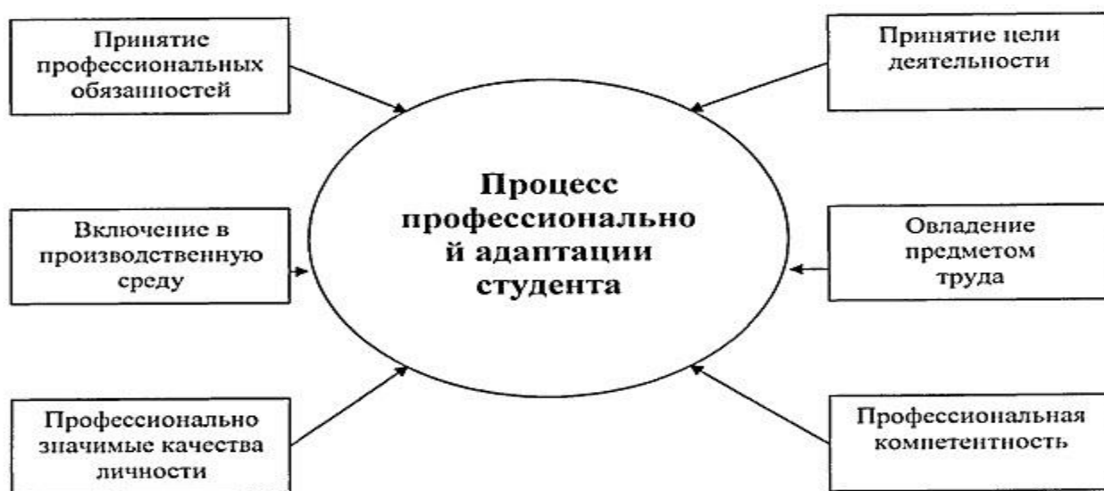
Рис.1. Факторы профессиональной адаптации студентов.

Согласно определению из Большой Советской энциклопедии: «Адаптация – совокупность физиологических реакций, лежащих в основе приспособления организма к изменению определенных условий и направленная на сохранение относительного постоянства его гомеостаза (внутренней среды)». Под адаптацией понимают все виды врожденной и приспособительной деятельности человека к общеприродным, производственным, социальным условиям, к анализу внешних и внутренних факторов, влияющих на процесс адаптации студентов. В обобщенном виде результаты представлены на рисунке.